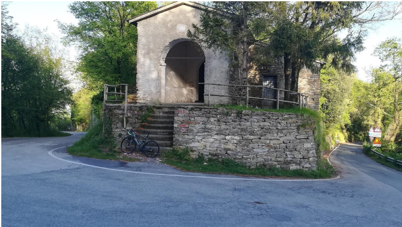
(Il passo della Crocetta, crocevia del Brevetto, 599 m.s.l.m.)

Il Brevetto della Crocetta prende vita da una fonte di tradizioni orali che, per pura sfida alla fatica ed alla forza di gravità, ha sempre posto come (quasi) impossibile il raggiungimento dell'obiettivo.