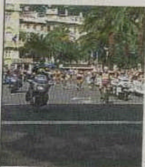
L'arrivo a Rapallo dell'edizione 2009

S i corre oggi sulle strade della Lombardia e della Liguria la 52ª edizione della "Milano-Rapallo", corsa ciclistica internazionale under 23 ed elite organizzata dalla società Geo Davidson. La partenza è prevista a mezzogiorno da Gaggiano, in provincia di Milano; l'arrivo è